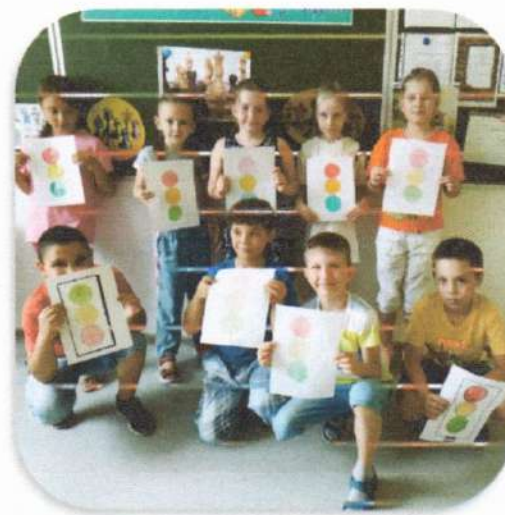
Веселый урок « Мы знаем правила дорожного движения»