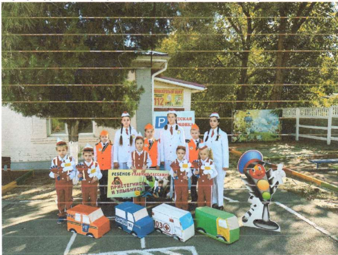
нерегулируемом перекрёстке (ул. Коммунистическая – ул. Иноземцева)